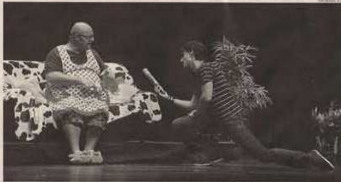
Una comedia que, seguro, cumplirá con las expectativas de los aficionados a este tipo de teatro en el Espinel.

Comedia y monólogo se mezclan en esta obra en la que el teatro es el verdadero protagonista. Un escenario casi desnudo y dos